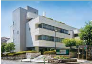
(公財)世田谷区保健センターは区立保健センターと区立総合福祉センターを運営しています。

☎3410-9101(代) 〒154-0024 世田谷区三軒茶屋 2-53-16